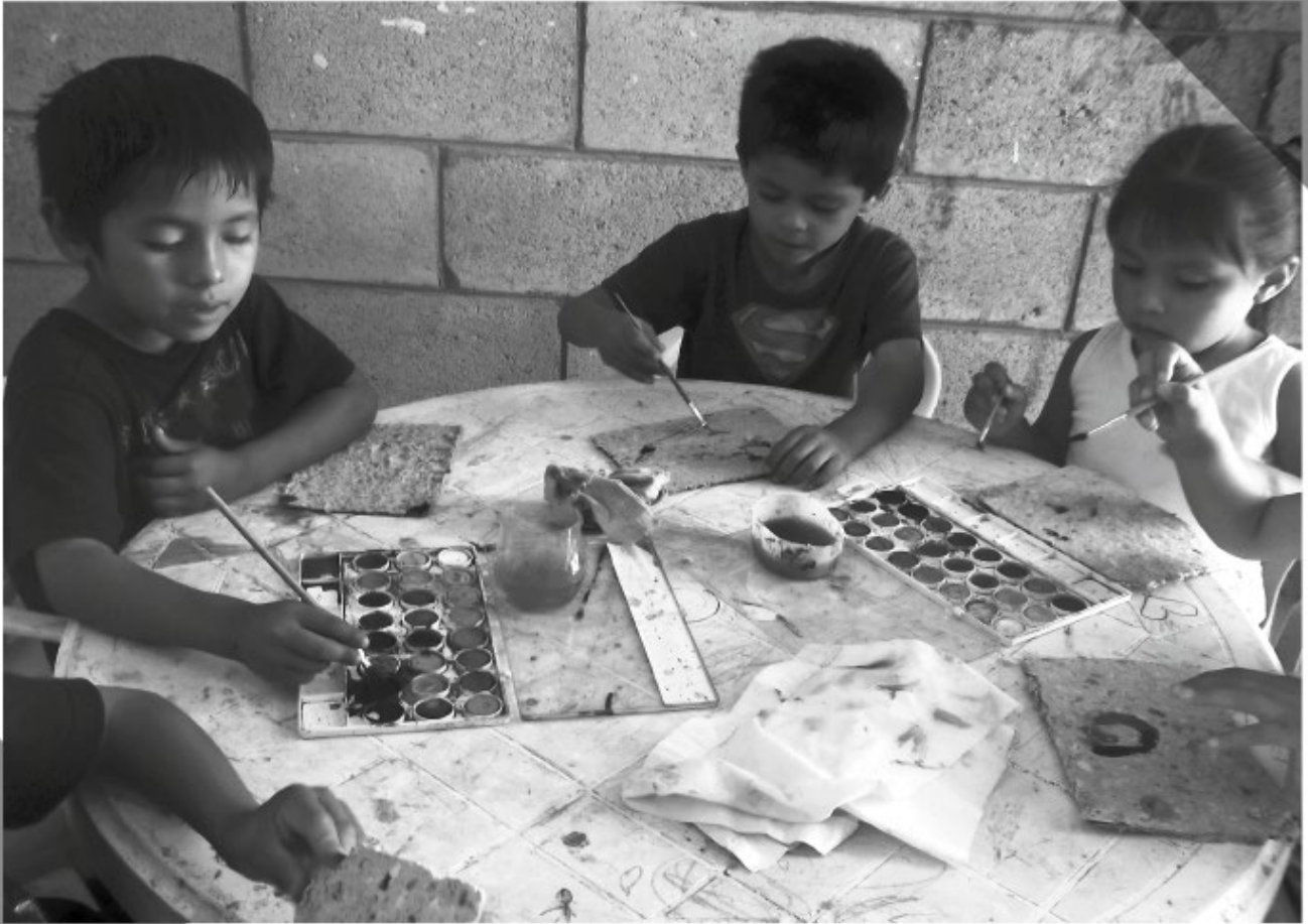
Para hacer más visible la problemática, se llevó a cabo un análisis de las intervenciones sociales y educativas, con la participación de niños hasta los 8 años de edad.

La mayoría de las víctimas de asesinato son hombres jóvenes, en muchos casos a cargo de sus familias, cuyas mujeres pasan a ser las responsables de la familia.